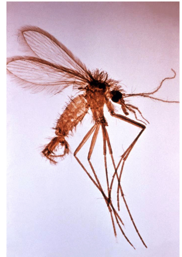
mosquito flebotomo, transmisor de la leishmaniosis